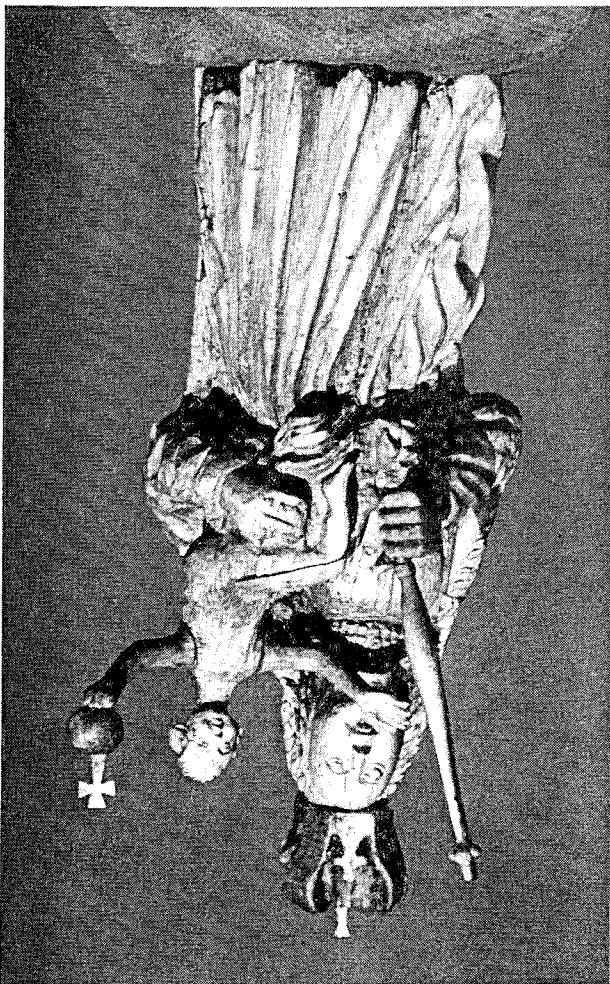
een laat-gotische madonna in een gevelnis van een gedeelte der slotkapel in de resten van het kasteel „Oberhausen“.