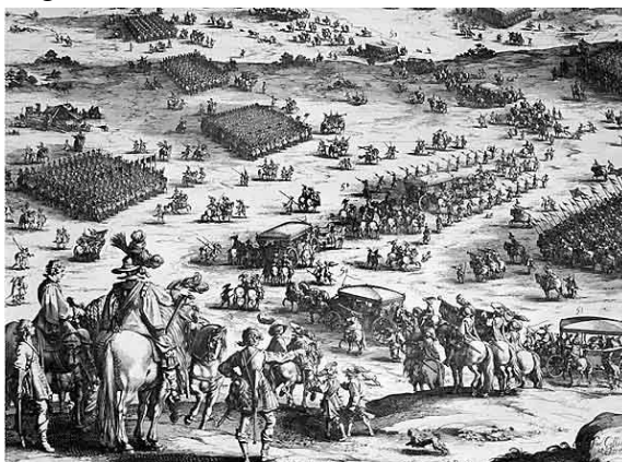
Onder de Spaanse soldaten die Breda belegerden was een schuinsmarcheerder die in Ginneken vertier zocht

Het komt in Nederland vaker voor, dat de ene gemeente door een andere opgeslorpt wordt. We schreven reeds eerder over de vierkante meter Bocholtzer soevereine moederaarde, die in Orsbach beschut wordt. Zo werd Ginneken geannexeerd door Breda, maar dat mag de carnavalspret niet drukken. Ook in Ginneken werden in de middeleeuwen, vastenavond op 11 november, dus de vastenavond voor de kersttijd, en de avond voor Aswoensdag, zeer uitbundig gevierd. Men ontdekte daar een oud document dat opgenomen werd in het boek 'De gouden eeuwen van het Ginneken'.