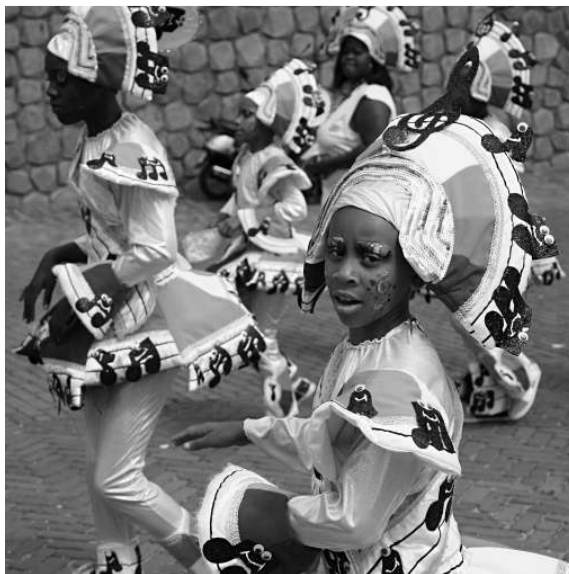
Arnhem Rio aan de Rijn

financieren, zoals zorg voor invaliden en straatkinderen in Rio.