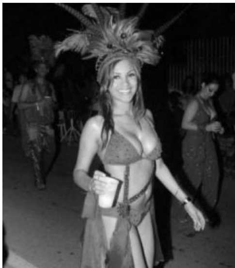
Braziliaans carnavaal in Groningen