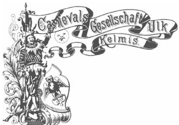
Carnevalsgesellschaft Ulk Kelmis

Vaals dacht een ‘Vierlandenpunt’ te bezitten, maar daar was geen sprake van, want Neutraal Moresnet beschikte niet over een Grondwet, had geen autonomie en was niet soeverein. Bijna 100 jaar kon deze tragische toestand zich handhaven. Het is heel bijzonder dat in dit neutrale gebied reeds op 23 maart 1879, door drie employés van de zinkmijn Vieille Montage , een carnavalsvereniging met de naam Ulk zu Kelmis opgericht werd. Vanaf