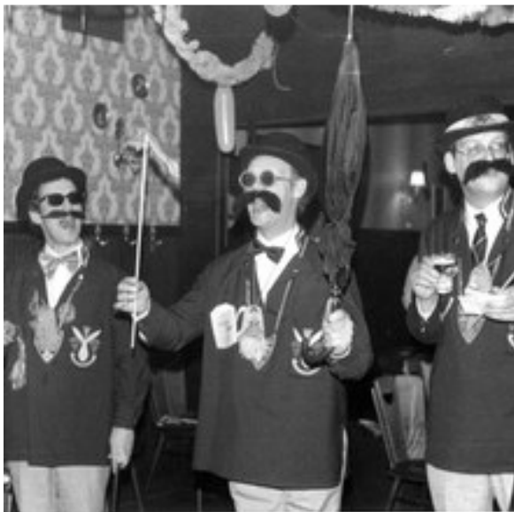
Over het Blikenstadse carnaval werd een expositie ingericht

galmbeker en héél veel medailles te voorschijn. Of Allow in zijn nieuwe woonplaats het carnaval kan ‘trekken’.