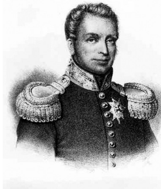
Koning Willem I

In het eerste chronogram wordt dus duidelijk gesteld dat Rastatt vrede stichtte tussen twee vogels; de Gallische haan en de Duitse adelaar. Het tweede chronogram stelt met een religieuze spreuk duidelijk, dat de bewoners van de katholieke Zuidelijke Nederlanden hun hoop op God vestigden en het derde getuigt van lof en vermaardheid over de dappere Habsburgers. In 1714 vertrokken de laatste Spanjaarden en Karel VI van Habsburg (Oostenrijk) gebood Joseph von Königsegg het bewind in de Zuidelijke Nederlanden over te nemen. Jammer dat met betrekking tot folkloristische gebruiken in de Oostenrijkse Nederlanden niet bewaard is gebleven.