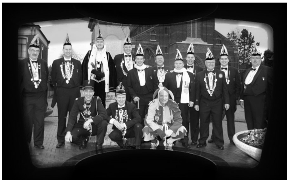
Sas van Gent heet in carnavalstijd Betekoppen

We kunnen het ons niet voorstellen: carnaval in Zeeland. De provincie ligt weliswaar ten zuiden van de grote rivieren, maar de calvinistische regelzucht heeft haar eigen wetten en geboden. In Sas van Gent halen vermetele vastenavondvierders een blauwe boerenkiel uit de mottenzak, maar sinds het Partagetractaat (1661) proberen protestanten aan de 'seksuele' uitpattingen, zoals zij het noemen, een einde te maken.