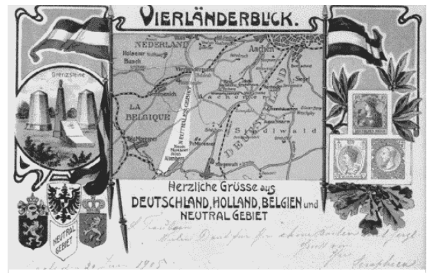
Neutraal Moresnet is de witte taartpunt

heerschappij), want Pruisen erkende de inspraak van Nederland niet en beschouwde Kelmis als een vazalstaatje. Ook het zgn. Tweeherenverdrag van Aken , op 26 juni 1816, kon daarin geen verandering brengen. Het gevolg was, dat Kelmis met de naam Neutraal Moresnet als ‘provisorium’ door het leven moest.