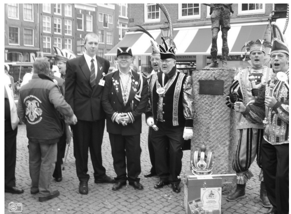
Carnavalspromotie in Amsterdam bij het Lievertje door onder meer de Geuzenkneuters

In Amsterdam werd in de middeleeuwen viriele vastenavond gevierd, maar daar maakten Kalvijn en zijn volgelingen resoluut een einde aan. De Geuzennaam 'Mokum' is bewaard gebleven en feitelijk was het ooit een