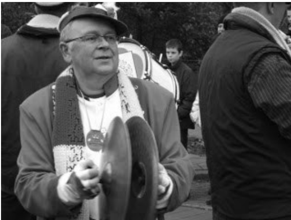
Als je maar leut hebt Carnaval in het noorden des lands

Het sorteert weinig effect om een hoofdstuk aan Hollandse poldercarnaval te wijden. Boven de grote rivieren is carnaval net zo ongemeen als een goed glas bier. Oude documenten geven weliswaar prijs, dat reeds in de middeleeuwen, in de Lage Landen, intensief vastenavond gevierd werd. Maar er is vrijwel niets overgebleven. De oorzaak is bekend, want in de 16 e eeuw, kwam er vooral in de protestantse gebieden, een einde aan de massale vastenavondvieringen. Het fervente feest bestaat niet meer, slechts hier en daar