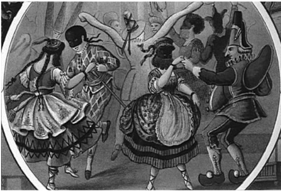
Eind 19e eeuw werd in Noord-Nederland nog steeds carnaval gevierd zij het in balzalen met genodigden - Kinder Feesten