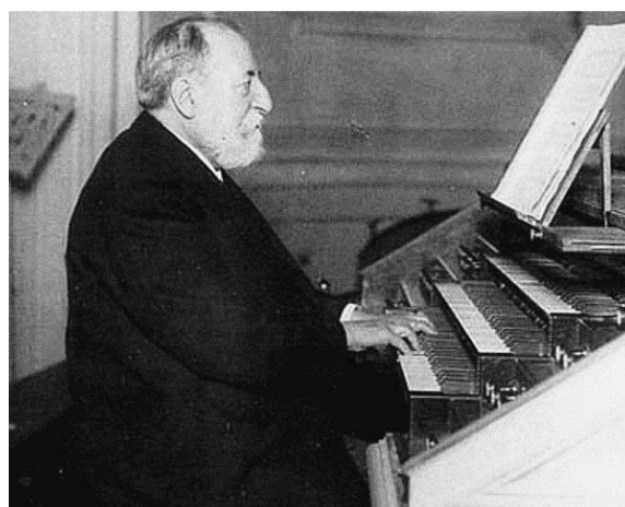
Nog een keer Camille Saint-Saëns

In De Bilt gooit men carnaval over de klassieke boeg. Carnaval wordt op een heel bijzondere wijze onder de aandacht van de schooljeugd gebracht. Omdat de kinderen van nu, de concertbewoners van de toekomst zijn, wil de Stichting Mezzo Forte Piano door een schoolconcert carnaval onder de aandacht brengen. De uitvoering bestaat uit: Het Carnaval der Dieren , uit 1886. Dat is een veertiendelige compositie van de Franse componist Camille Saint-Saëns. Hij beeldt in de compositie, op een paar stukken na, een aantal dieren uit. Het zijn voornamelijk de karakteristieke eigenschappen van de dieren die, een beetje satirisch maar soms ook zeer treffend, weergegeven worden. Het wordt ten gehore gebracht door een ensemble van tien jonge musici (inclusief het pianoduo), allemaal laureaten van internationale concoursen. Een verteller introduceert het stuk en verbindt de delen.