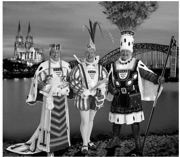
Dreigestirn Keulen 2006

Duitse Rijnland aan Pruisen. In 1822 staken in Keulen een paar mannen de knappe koppen bij elkaar, om vastenavond nieuw leven in te