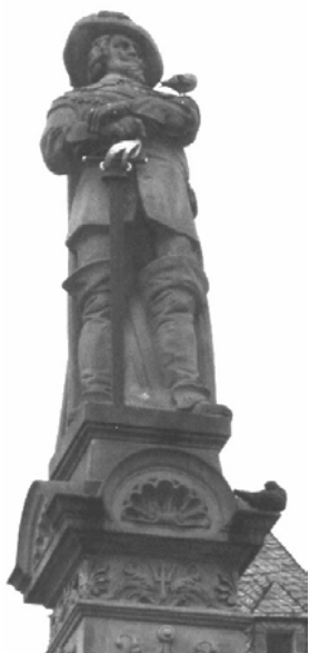
Standbeeld Jan von Werth te Keulen

De bekende heldenfiguur en generaal Jan van Werth (1591-1652), wiens standbeeld sinds 1895 op de Altermarkt staat, werd in 1925 naamgever voor het luxe ruiterkorps Kölner Karnevalsgesellschaft Reiterkorps Jan von Werth e.V. Zonder uitzondering waren de oprichters rijke