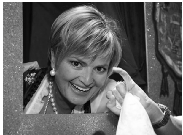
Gloria von Thurn und Taxis

Waarschijnlijk kunnen wij ons nog herinneren aan de tv-uitzending via de ARD op zondag 20 januari 2008, toen de eclatante en voorbeeldige vorstin Gloria von Thurn und Taxis in Aken de doorluchtige decoratie Wider den tierischen Ernst in ontvangst mocht nemen. Een van de voornaamste vrouwen van Duitsland, eigenaresse van 120 brouwerijen, uit het land van fasching en carnaval, bracht met allure en verve, de mensen in de zaal en voor de buis in vervoering. Heel even sloeg zij een brug tussen de eeuwenoude vastelavond en het relatief jonge carnaval.