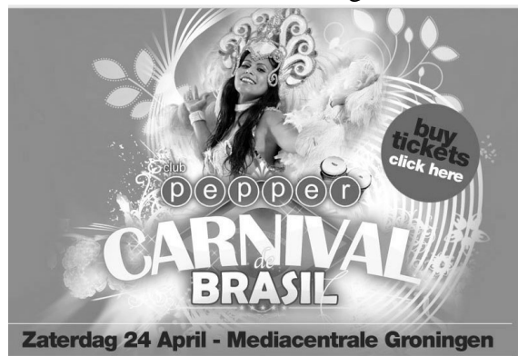
Braziliaans carnaval in Groningen

Het is soms kil, om niet te zeggen koud, in de polder. Daar hebben inwoners van de Groningse metropool iets op gevonden. Met carnaval worden de kachels in de ‘exotische’ feestzalen roodgloeiend gestookt, want bij de opzwepende klanken van de batucuda, samba en forró moeten de luchtig geklede dansers en toeschouwers van de kleurige expressie genieten. Om de mensen te leren hoe het functioneert, worden echte Braziliaanse bands en dansgroepen naar Groningen gehaald. Die chocoladebruine mensen staan garant voor