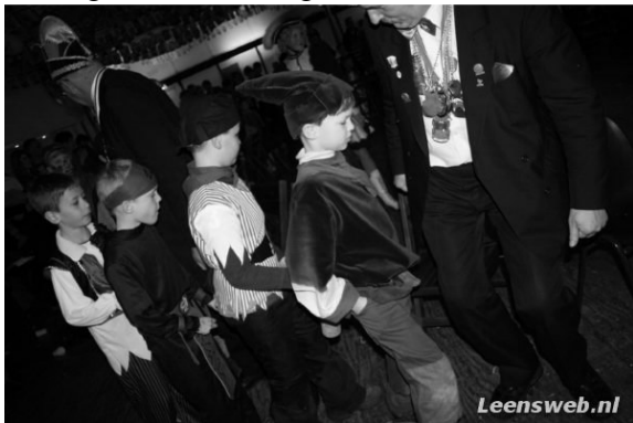
Kronkeldorp richt zich ook op kinderen

helemaal niets met Rijnlandse geweren, sabels en neponderscheidingen te maken. In dat protestantse noorden (van ons land), bevindt zich de katholieke exclave Kloosterburen, temidden van een reformatorische godvrezendheid. Dat neemt niet weg dat vele duizenden rechtlijnige protestanten met carnaval een kromme toer naar Kloosterburen maken. Het is historisch bewezen dat hier zelfs tijdens de Tachtigjarige Oorlog vastenavond gevierd werd.