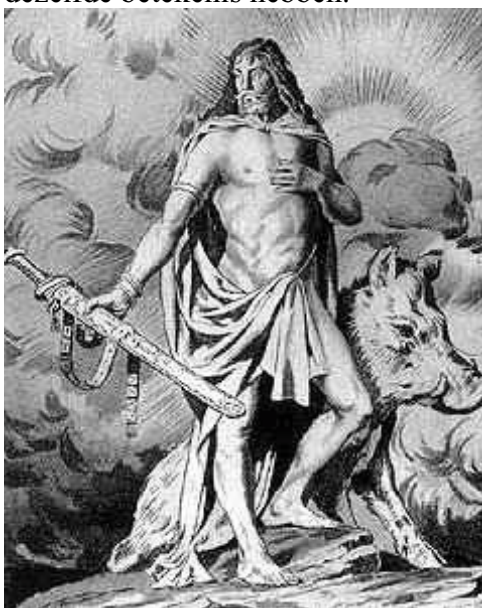
De Germaanse god Frey

te maken. Voor de etymologie van het woord vastenavond , moeten we terug naar de 13 e eeuw. Het oudste bekende woord is vasnach , vervolgens is er sprake van vaschang en op andere plaatsen vanaf 1283 fasching . Tegen het einde van de 13 e eeuw komen we in Duitsland het woord Fastnacht en in Nederland vastelavond tegen. Het stamwoord fas werd afgeleid van het middeleeuwse faseln , hetgeen we vertalen kunnen met: bevruchten maar ook met vruchtbaarheid. In jeugdboeken wordt faseln ook wel vertaald met ‘bazelen’... Maar de feitelijke vertaling luidt: ‘De onvruchtbare wintergeesten verjagen door provocerende paringsrituelen’. In Nederland kennen we het synonieme ‘werkwoord’ vozen . Sommigen historici suggereren, dat kerkelijke schrijvers, in het kader van hun syncretisme, het ‘werkwoord’ faseln veranderden in fasten , om de relatie met de vastentijd nadruk te verlenen. Maar we mogen niet ontkennen dat vozen en faseln dezelfde betekenis hebben.