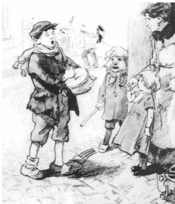
Met de foekpot van deur tot deur

een omhaal aan weelderige woorden kunnen vertalen met: 'Het feest van de bronst bij een vruchtbaarheidbrengende goudgele zon'. We weten niet, of de Germanen muziek maakten, maar bij de latere middeleeuwse vastenavond speelden 'instrumenten' een belangrijke rol. Meestal maakte men gebruik van kakofonische ketelmuziek en een typisch vastenavondinstrument was de foekpot . Etymologisch is foeke afgeleid van foeken, fokken of stoten. Reeds in 1503 gebruikte men in Engeland het begrip to fuck , hetgeen ook 'beslapen' kan betekenen.. De foekpot was feitelijk een aarden pot met als deksel een varkensblaas of een dun vel. Feitelijk is het een membraaninstrument , maar gelijktijdig een strijkinstrument , zodat de bijnaam 'stampviool' wel duidelijk is. Door via een gaatje in dat vel met een dun rieten stokje op en neer te bewegen, ontstond er een diepdonker gruwelijk geluid. In Duitsland, het vaderland van Faselabend , spreekt men over een 'Narrengeige'. In de steeds dubbelzinnige vastenavondsfeer, had de foekpot naast geluidsbron, ook een visueel virtuele betekenis... Ook de liedjes, die het grut zong, waren soms dubbelzinnig: "'Ouwe jaarke douwe, de poeskes zijn verkouwe!'" Maar dat wisten natuurlijk de kinderen niet, die met zo'n foekpot van deur tot deur gingen. Mijn eega kan zich goed herinneren dat zij rond