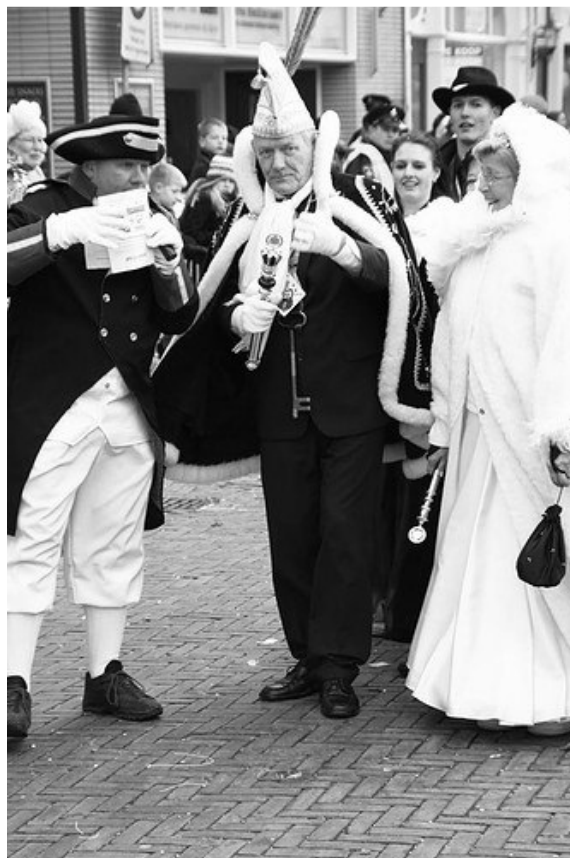
Carnaval in Blikenstad (2)