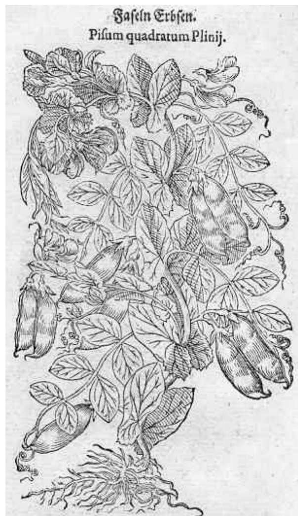
Faseln Erbsen, een vruchtbare erwtenplant

We merken dat vastenavond in zijn oervorm, aanleiding was om het ‘sterven’ van de winter en de ‘geboorte’ van de lente, zijnde een feest van vruchtbaarheid en vernieuwing te vieren. De Germanen maakten gebruik van een schip op wielen, waarmee zij door de velden trokken om de goden gunstig te stemmen. Een beeld van hun god Frey werd op een scheepskar begeleid door een stoet uitgelaten mensen, die als dieren vermomd waren, om de walgelijke wintergeesten te verjagen. Aan