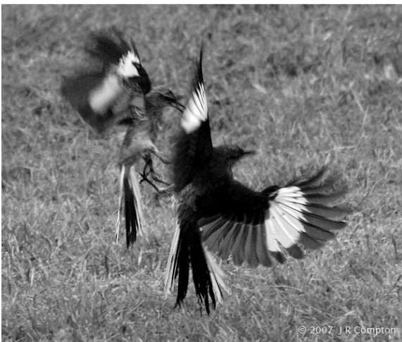
Gevecht tussen 2 vogels

Over vastenavond in de Habsburg-Oostenrijkse tijd, is vrijwel niets bekend. De episode begon in 1714 en was klaarblijkelijk zeer belangrijk, want boven het poortgebouw van de prachthoeve Overhuizen, komen wij dat jaartal in de vorm van een chronogram drie maal tegen. Aan de bovenkant van het fronton staat: RASTADIVM BINAS PACIFICAT AVES. (Rastatt stichtte vrede tussen twee vogels.) Boven de linker pilaster staat in het Frans met kapitalen en kleine letters: DIeU fait ICI toVt Mon esperanCe (Hier is al mijn hoop op God gevestigd.) en boven de rechter pilaster staat in het Italiaans met kapitalen en kleine letters: DeLLa VIrtV La gLorIa e gIIderDone (De roem is de beloning van de dapperheid.) Drie chronogrammen met allemaal hetzelfde versleutelde jaartal 1714. Heel gewis was 1714 een bijzonder jaar. Reeds op 11 april 1713 werd de 'Vrede van Utrecht' in de Republiek der Zeven Verenigde Nederlanden getekend om te voorkomen dat aartshertog