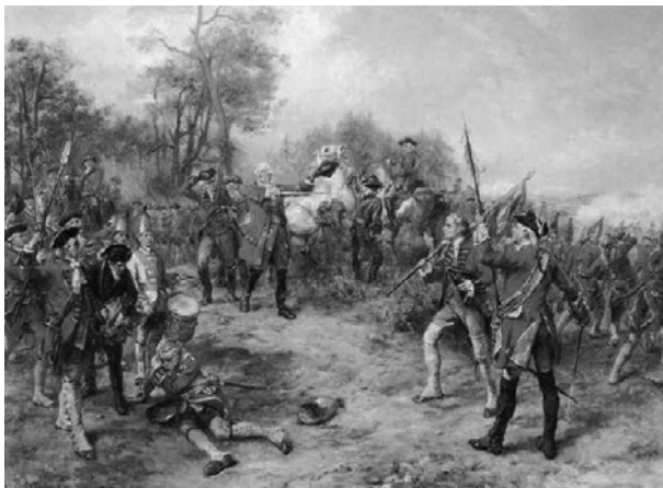
De vele oorlogen deden de vastenavondvieringen geen goed

We lezen nog wel eens dat het de Fransen waren, die in 1794 een einde aan de vastenavond maakten, zodat er tussen Rijn en Maas, een abrupt einde kwam aan het frivole feestgedruis. Dat is klinkklare kolder, want de waarheid gebiedt te schrijven, dat in onze streek in de 18 e eeuw de Spaanse Successieoorlog (1702-1713), de Oostenrijkse Successieoorlog (1740-1748), de Zevenjarige Oorlog (1756-1763) en de Luikse Revolutie uitgevochten werden. Zelfs als onze voorouders niet direct hierbij betrokken waren, zo kregen zij te maken met buitensporige belastingen, die toen contributies en executies genoemd werden.