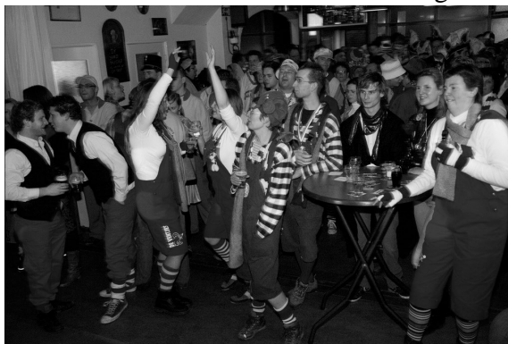
Sas van Gent ter voorbereiding op het carnaval werd het Leutfeest of wagenbouwersfeest gehouden