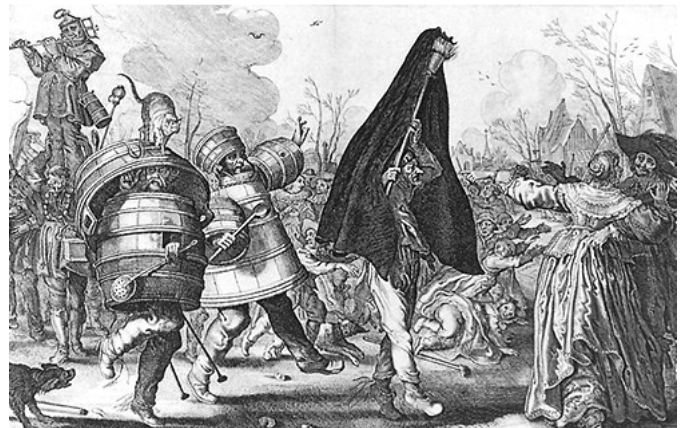
Vastenavondoptocht met vermommingen naar Adriaen van de Venne Delft 1589-1662

Zwaben en andere Alamannische feestvierders kruipen ook nu nog in een dierenvel. Carnavalisten tussen Rijn en Maas trekken een uniform aan en paraderen bij pittige marsmuziek. Brabanders grijpen naar een blauwe kiel. We weten inmiddels ook, dat de verschillen tussen vastenavond en carnaval legio zijn. Het eerste werd opgehangen aan heidense tradities, waarbij vermomming een belangrijk aspect was. Carnaval is weliswaar commerciëler maar ook christelijker, zodat zich inmiddels in Nederland, Kerk en carnaval verzoend hebben.