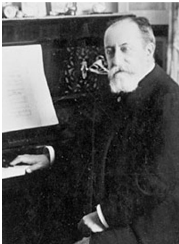
Een klassieke compositie van Camille Saint-Saëns moest het carnavalsgevoel overbrengen

woedend omdat er gevierd werd op kosten van de belastingbetaler. Ook GroenLinks was van mening dat er te veel geld besteed werd aan 'gezellige' projecten.