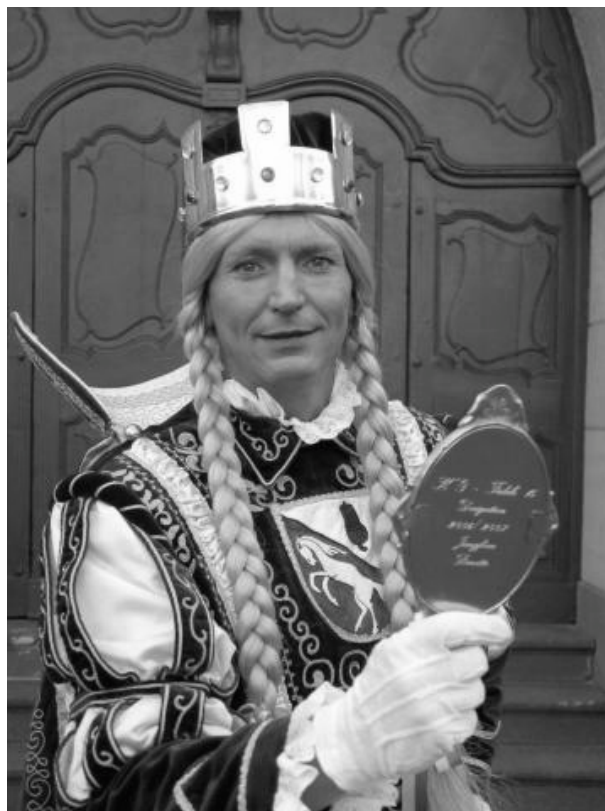
Die Jungfrau was doorgaans een man

Pruisen dat de mollige marketentster door een man gefigureerd moest worden. Daar waren de Nazi's, die een hekel aan travestie hadden, het niet mee eens, zodat de Jungfrau in 1934 een pathologische vrouw werd. Doch meteen na de oorlog werd 'ihre Lieblichkeit' (de maagd), opnieuw in haar mannelijke eer hersteld. Ook der Boor (de boer) , die reeds in een document uit 1422 genoemd wordt, verhuisde van vastenavond naar carnaval. Pas in 1871 mocht de 'held' zich prins noemen en werd aan zijn zijde prinses Venetia gezet. De kortgerokte Tanzmariechen zijn van veel latere datum en hebben helemaal geen relaties met vastenavond . Het is leuk te vermelden dat toen ook die andere mannenwereld, de schutterij, meer dan gewone belangstelling voor vrouwen toonde. Vanaf 1970 mochten marketentsters de mannen begeleiden. Terug naar Duitsland, waar het mannen, in de Nazi-tijd, streng verboden was, om zich in vrouwenkleren te vertonen, zodat travestie in 1938 verboden werd. Veel Limburgse 'carnavalogen' beweren ook nu nog, dat vastenavond en carnaval hetzelfde is. Inmiddels weten wij wel beter.