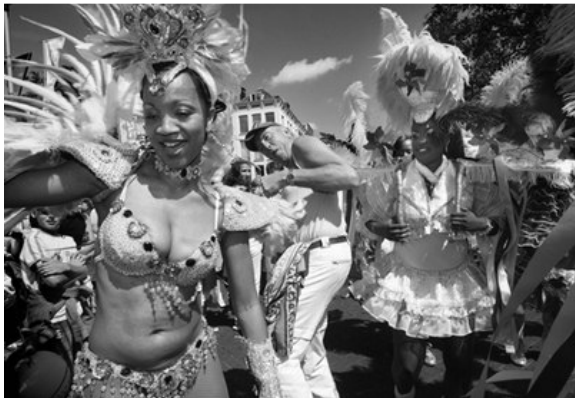
Zomercarnaval in Rotterdam

cohesie in de maatschappij. Het is juist bedoeld om de verharding van onze maatschappij tegen te gaan en participatie van de bevolking te optimaliseren. In die zin vervult het zomercarnaval een preventieve functie. (...)