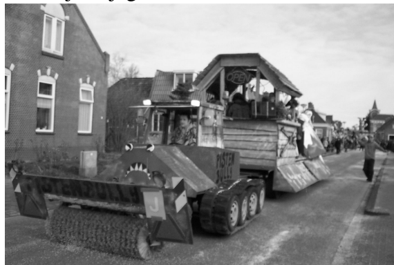
Optocht door Kronkeldorp-Kloosterburen

niet leuk vinden. In 1972 trok de eerste optocht door Kronkeldorp (Kloosterburen) en met enige lef ook door de omliggende dorpen, doch in de protestantse periferie, werden de knapen en hun diabolische stoet, minder dan vriendelijk bejegend.