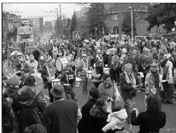
Ook dit is een beeld van Arnhem in carnavalssferen

Arnhem ligt bij de Nederrijn, net boven de grote rivieren en heeft niets met boerenkielen en helemaal niks met Keulse soldatenuniformen. De laatste jaren komt 'Rio aan de Rijn' met tropische klanken en dranken steeds meer in de belangstelling. Er is zelfs een optocht van het Caribische zomercarnaval, maar in feite is het een zeer zwakke afspiegeling van hetgeen ingehuurd Brazilianen van huis uit gewend zijn. Een Antilliaan zei achteraf: Het publiek aan de rand van de weg staat er passief bij en kijkt alsof er een lijkstoet voorbij komt ! (...)