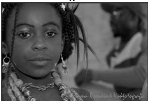
Braziliaans carnavaal in Groningen

Iemand die van Pruisische marsmuziek houdt, kan maar beter thuis blijven, want in Groningen is het samba en forró wat de klok slaat. Belangrijk is dat het ritme uit 'de heupen' komt, waarbij de samba een solodans en de forró een partnerdans is. Ook aan de inwendige mens wordt gedacht, want aan de eetbar geen gehaktballen en geen frikadellen, maar de typisch Braziliaanse gerechten: coxinha de galinha, bolinho de bacalhau en meer van die hete hapjes.