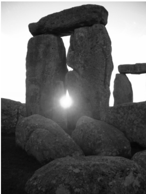
Gloria von Thurn und Taxis

Net zoals carnaval zich door een kristallisatieproces uit vastenavond ontwikkelde, zo evolueerde de 'christelijke' vastenavond zich uit vastelavond en een heidense joel- en vruchtbaarheidsviering. Bij de Germanen was het joelfeest een