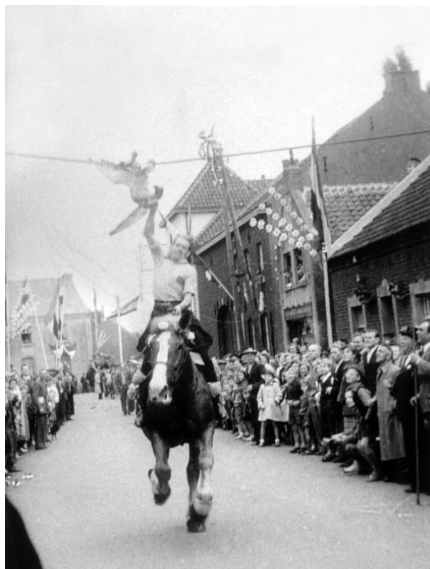
Ganstrekken Grevenbicht 1956

luidde dan ook: ‘In het beperkte aantal carnavalsstudies in Nederland weerspiegelt zich de achtergestelde positie van randgebieden tegenover het westen van Nederland’.