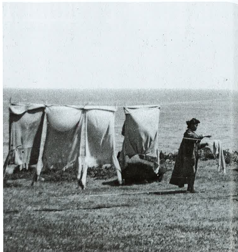
KOLONIE DANKZIJ DAMIAAN VERBETERDEN DE OMSTANDIGHEDEN VOOR DE LEPROZEN IN KALAWAO