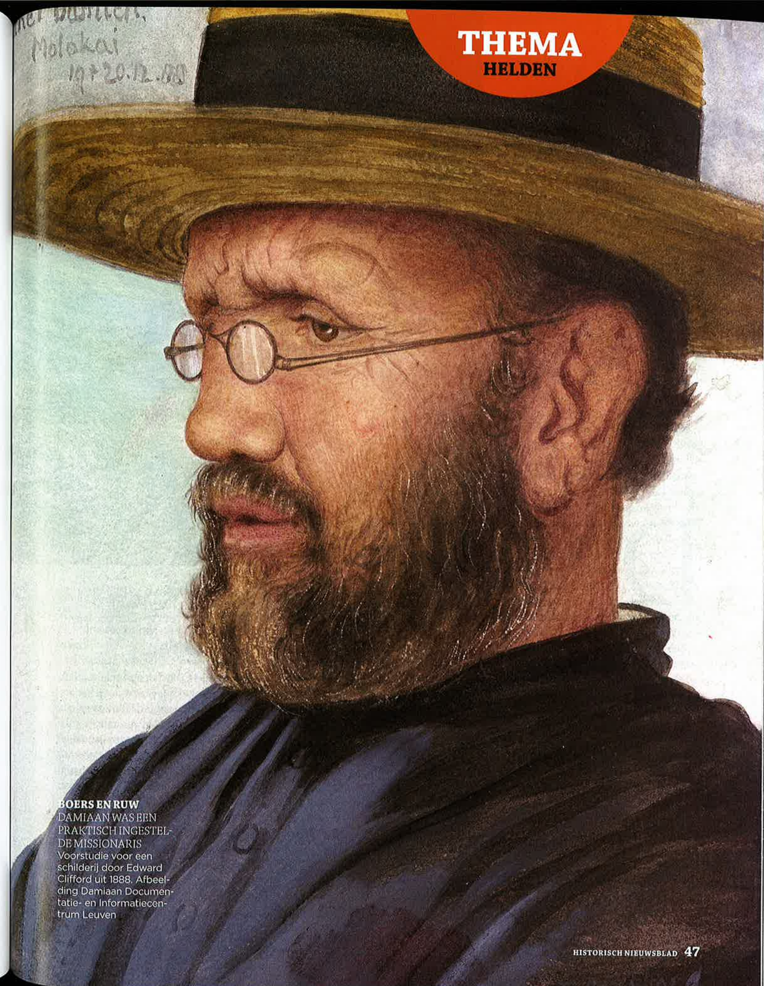
BOERS EN RUW DAMIAAN WAS EEN PRAKTISCH INGESTELDE MISSIONARIS. Voorstudie voor een schilderij door Edward Clifford uit 1888.

In de agrarische gemeenschap waartoe Jozef als jongeling behoorde, onderscheidde hij zich als een fysiek ingestelde, harde werker, die zich prima thuis voelde in de dorpskroeg; een daadkrachtige figuur die zich door weinig liet tegenhouden wanneer hij zich eenmaal iets had voorgenomen.