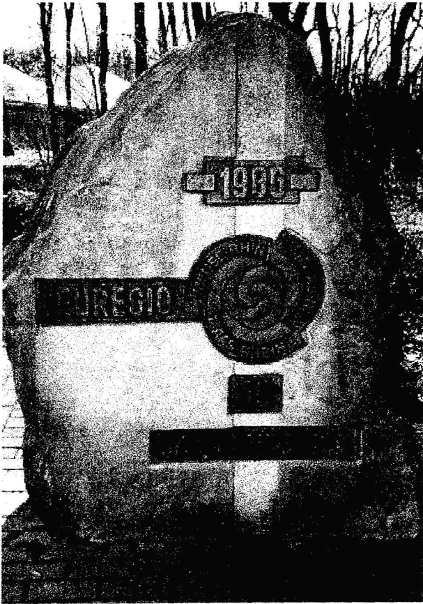
Het Euregiomonument op het Dreilandenpunt.