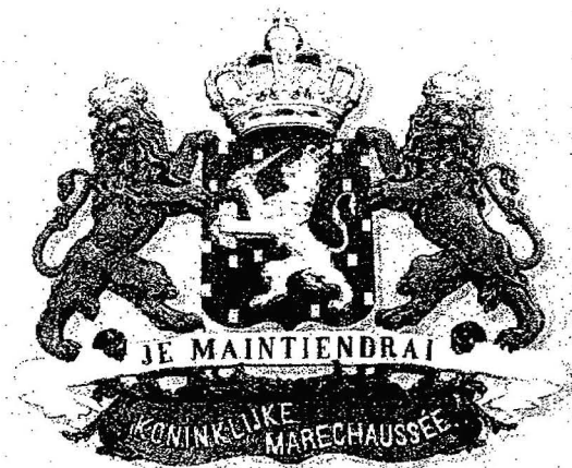
Het wapen van de Koninklijke Marechaussee.

Sinds mensenheugenis waren er familiebanden geweest tussen de bewoners van de diverse grote en kleine staatjes en was de inheemse bevolking nauw verwant aan zowel de Belgische als Duitse zijde, maar door de nieuwe grenzen zou dat anders worden.