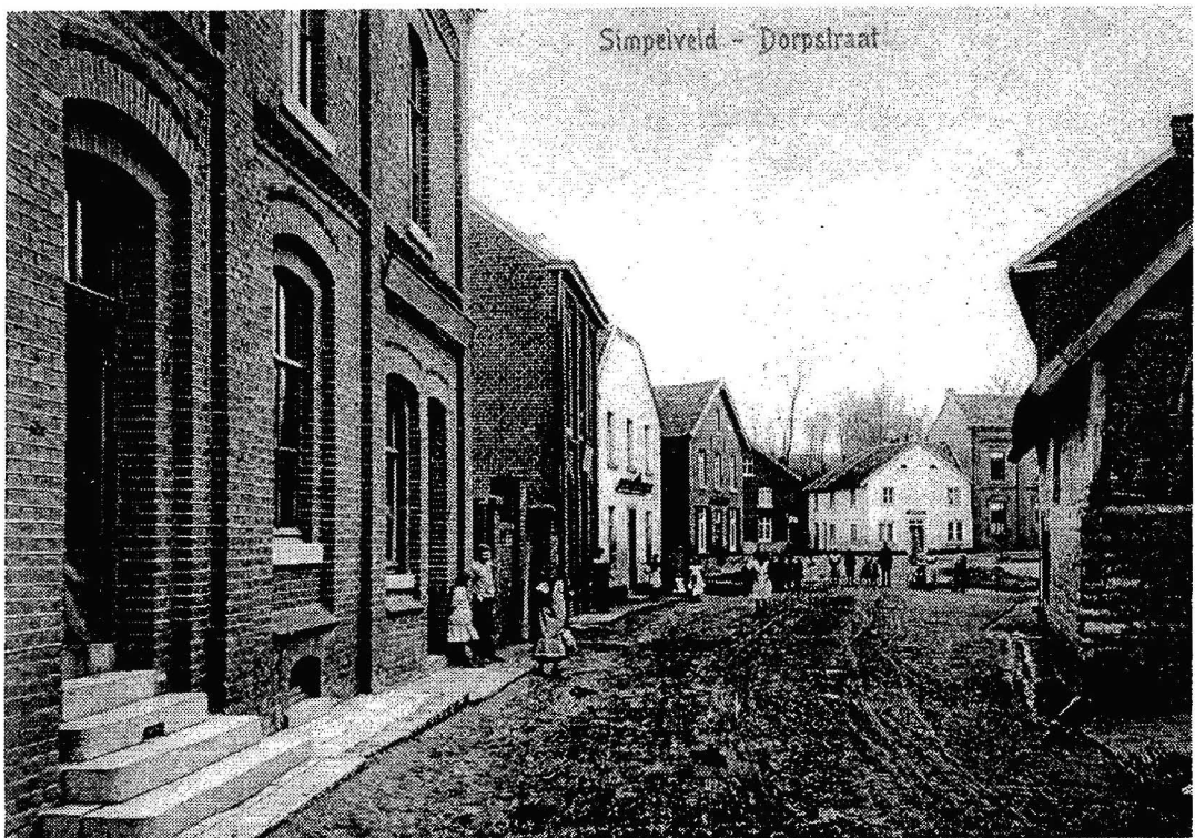
Rond 1920 zijn de Simpelveldse straten niet veel meer dan modderige karresporen.